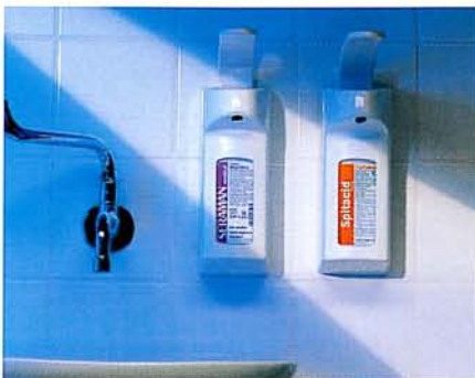
Leichte, hygienische Entnahme mit unserem Dermados-Wandspender