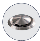
Tourelle d'extraction d'air