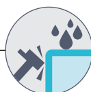
2 mm Épaisseur tôle IP55 / IK08 Indice protection