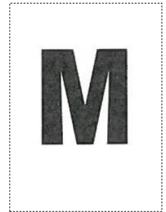
Etiquette taille pour sachet